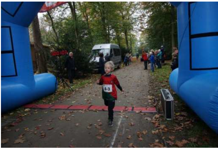
Sieger im Bambinilauf