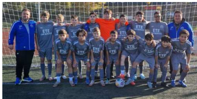
C2 mit ihren neuen Trikots von ETE Car