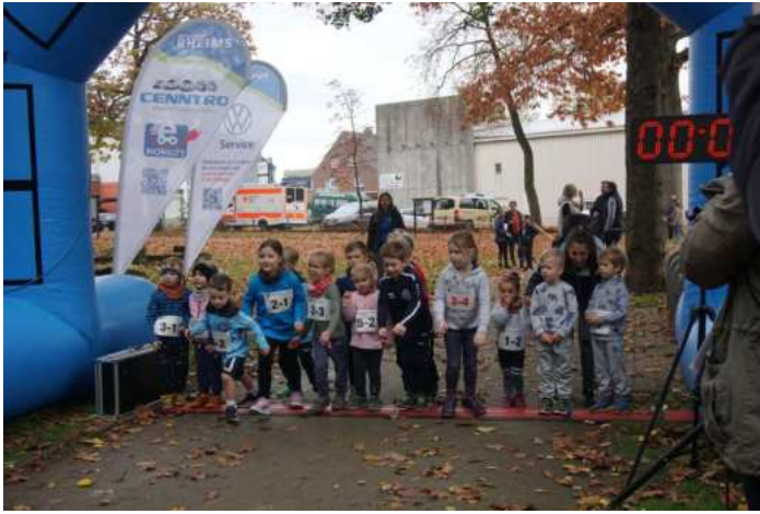
Start des Bambinilaufs