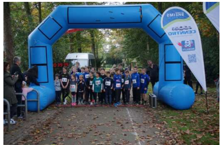
Start des 1000m Laufs

Mit zahlreichen Teilnehmern aus verschiedenen Sportgruppen des VfL