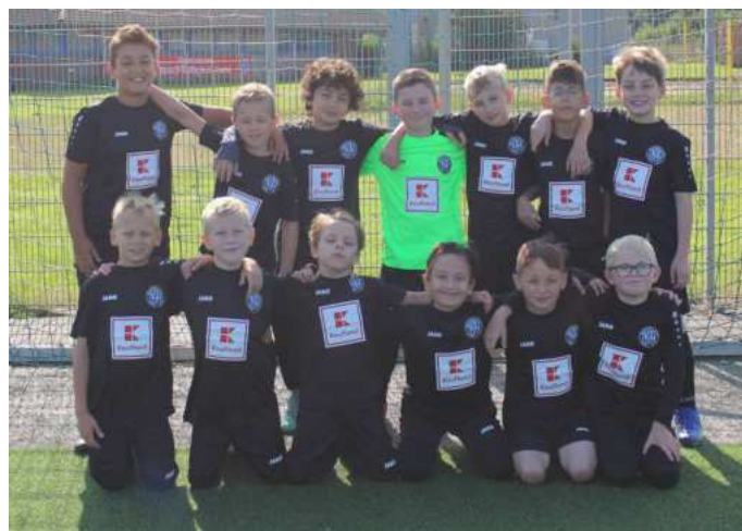
Die Mannschaft mit ihren neuen Trikots vom Sponsor „Kaufland“

Im Sommer führten wir intensives Techniktraining durch, um die individuellen Fertigkeiten weiter zu fördern und die Spieler optimal auf die laufende Saison vorzubereiten. Insgesamt war die Hinrunde ein großer Erfolg, die die Freude am Fußball und die persönliche Entwicklung der Kinder in den Mittelpunkt stellte.